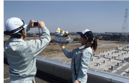
去年の撮影の様子

普段見ることのできない下水処理場をあなたのぬいぐるみが見学してその様子をアルバムにしてお渡しします。