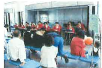
ロビーコンサート、踊りなどに

備品：電子グランドピアノ1台、マイク4本、 アンプ付きスピーカー2台、CDラジカセ1台