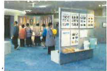
絵画、ポスター展示などに